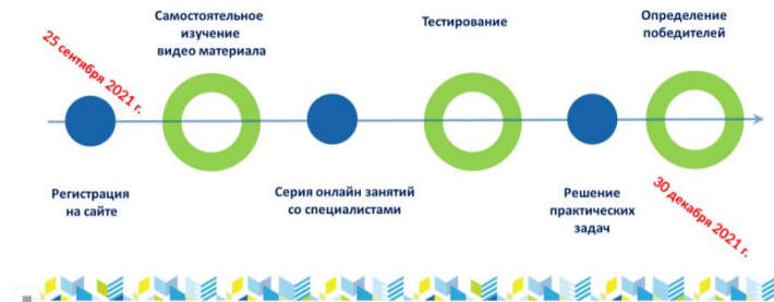
СХЕМА ПРОВЕДЕНИЯ ЧЕМПИОНАТА

Период проведения: 24.09.2021-30.12.2021