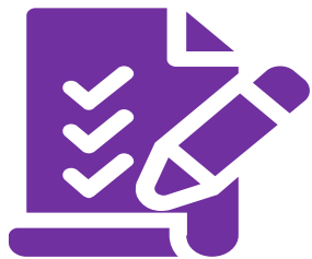
График проведения занятий